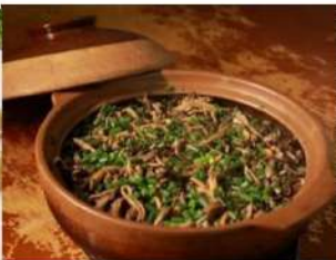
五邑招牌黄鳝饭宴