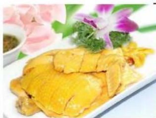
White Cut Chicken