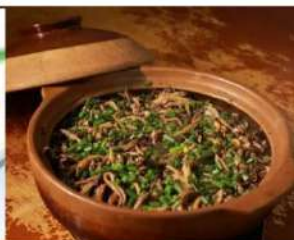
Taishan Yellow Eel Rice