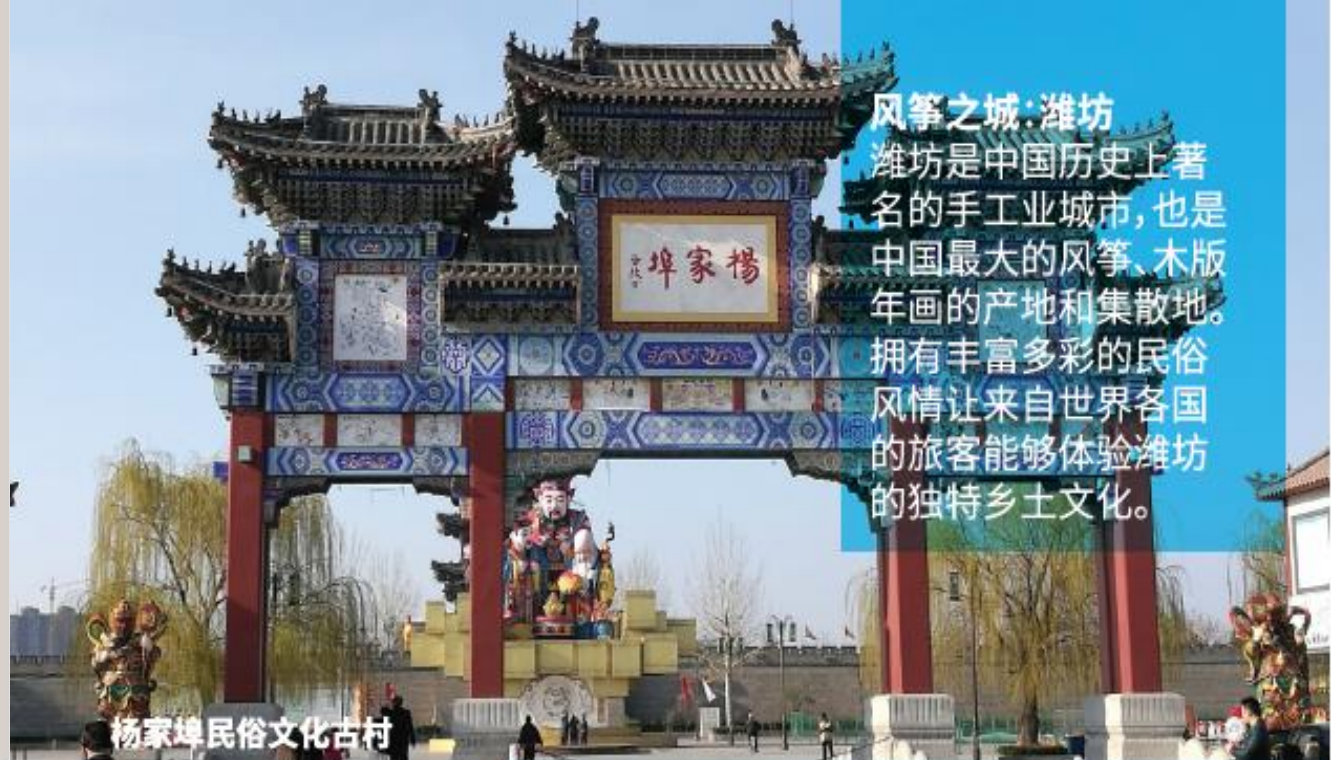
杨家埠民俗文化古村

这个博物馆除了是旅游景点之外，同时也是张裕高档葡萄酒酿造的基地，也是种植多种葡萄品种的欧式酒庄。